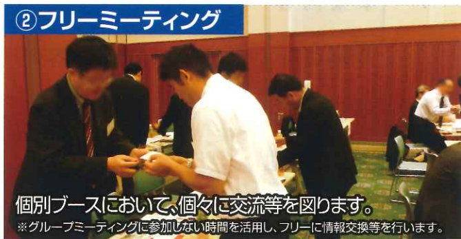
② フリーミーティング

参加企業を7社程度のグループに分け、1社につき4分間、自社PR・製品PR等を行います。 ※グループミーティングは全体で3回行いますが、その内2回の参加となります。