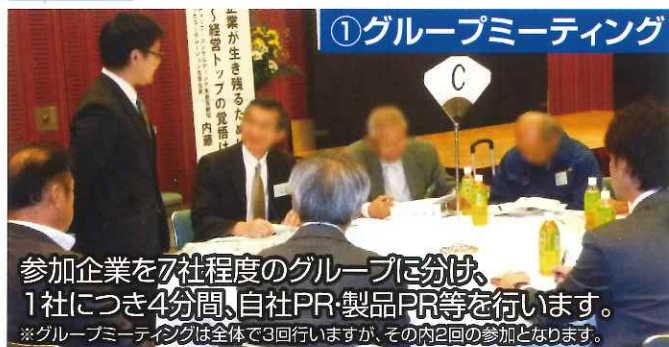
① グループミーティング

参加企業を7社程度のグループに分け、1社につき4分間、自社PR・製品PR等を行います。 ※グループミーティングは全体で3回行いますが、その内2回の参加となります。