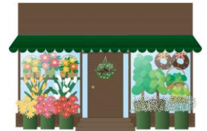
フラワーショップでも