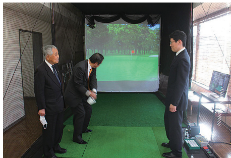
室内のスウィングラボ（解析室）