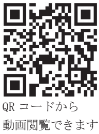
QRコードから 動画閲覧できます