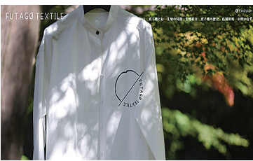
新しいウェブサイト URL http://www.futagotextile.com/

企業の販路拡大を目指し、統一されたイメージを発信できるようにWEBショップにおいても見直しを図りました。合わせて、ハイブランドにふさわしい、初のブローシャ（装飾的なパンフレット）を作成しました。ブローシャは、東京ビックサイトで開催された展示会において活用し、商談につなげることができました。