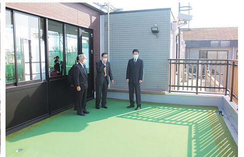
1組貸切のバター練習場