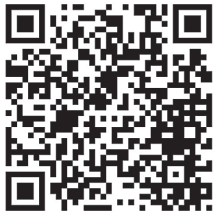
蕨商工会議所 ライン公式アカウント

の一環として有益な情報提供と、蔵の逸品紹介など配信しました。登録の推進については、HPや会報誌で告知する他、窓口相談や巡回指導の際に周知しました。また、事業所においても、LINE公式アカウントを開設することで、コロナ禍でも販路開拓に取組むことができるため、アプリの活用方法や活用事例、開設手順などが学べるセミナーを開催しました。