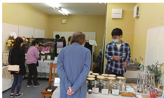
チャレンジショップ