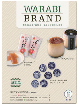
令和7年度に認定された蕨ブランド品3品

※蕨ブランド認定制度は3年に一度行われるため、令和10年度のみ 認定商品の販路開拓、販売促進支援 ・各事業年度 3社