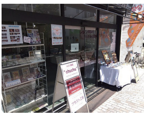
わらびチャレンジショップ

また、空き店舗有効活用事業補助金の申請にかかる審査等を行うエリアノベーション推進協議会を開催しました。 ・空き店舗有効活用事業補助金採択件数 5件