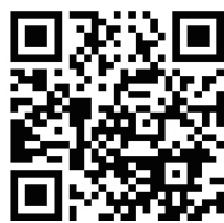
↑ 彩の国工場の案内はこちら

ました。これにより、不動産ではなく、企業が持つノウハウや顧客基盤、ブランド、将来のキャッシュフローといった「無形資産を含む事業全体」を一体として担保にすることが可能になります。原則として経営者の個人保証も不要になるため、事業者の思い切った事業展開や円滑な事業承継を後押しする効果が期待されます。